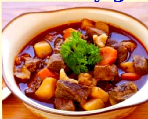
Thịt bò lộn sốt vang