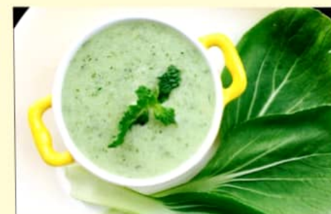
Cháo tôm thịt rau cải xanh