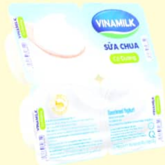
Sữa chua Vinamilk