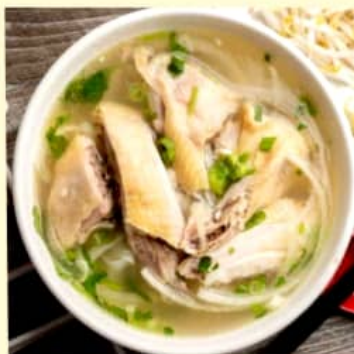
Phở gà Hà Nội