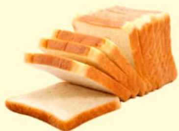
Bánh mì gối